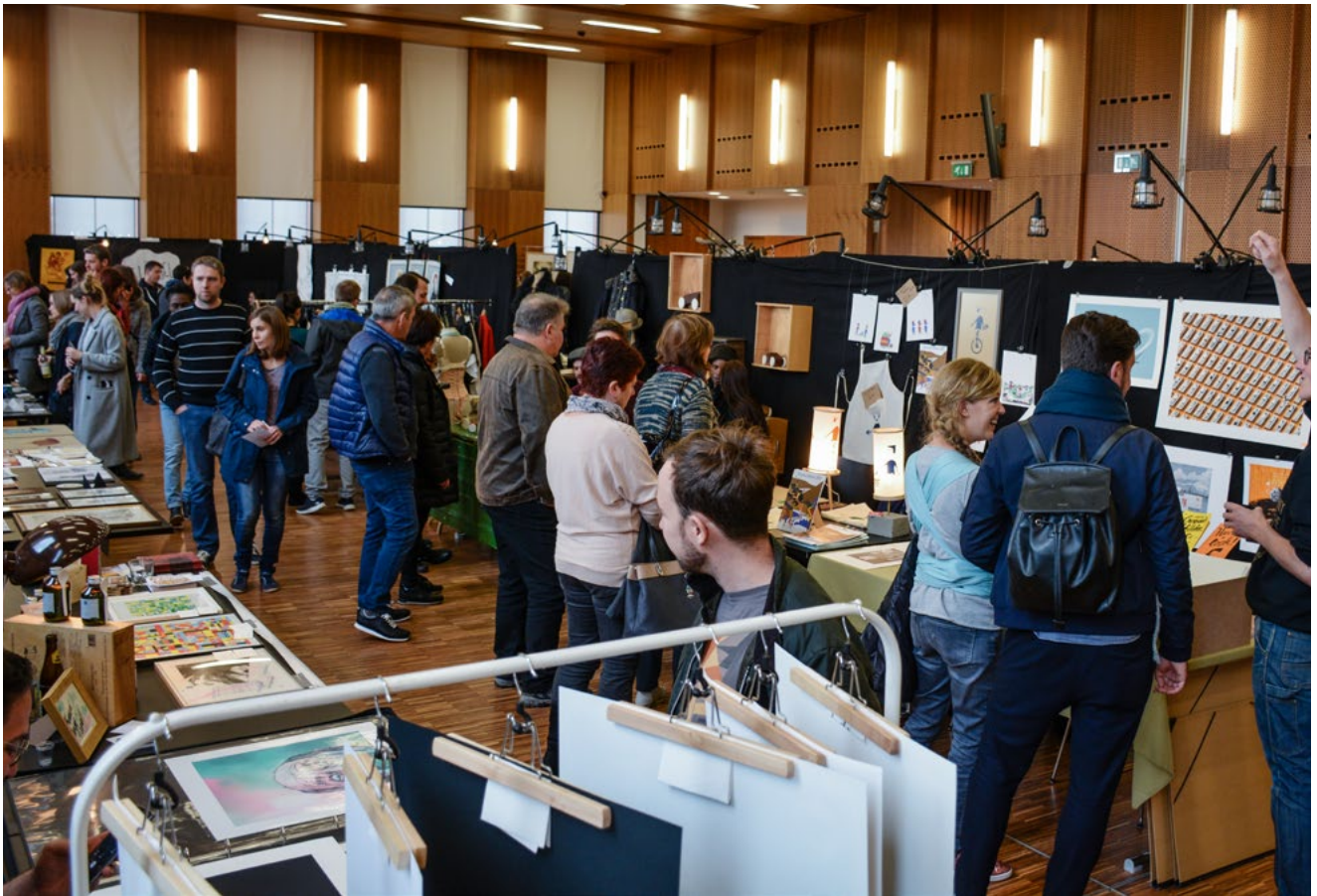
some impressions from the market space